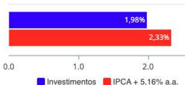
Investimentos x Meta de Rentabilidade